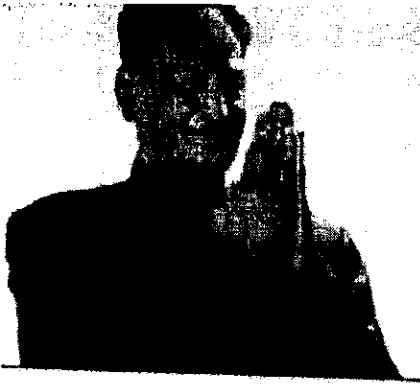
अशोक गहलोत, मुख्यमंत्री